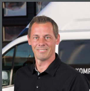
TUE LASSEN SERVICECHEF

E-Mail: khan@ankerservice.dk Mobil: 48 88 30 50